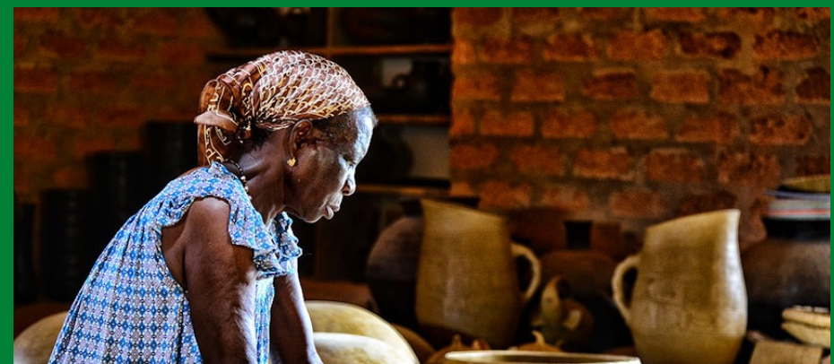
VALLEE DU BANDAMAN